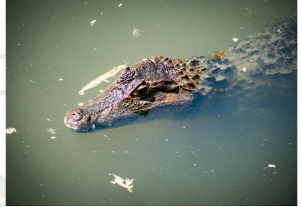
BABILLAS (CAIMAN CROCODYLUS FUSCUS)