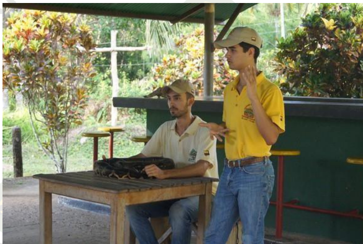
GUÍAS ECOLÓGICOS ESPECIALIZADOS

Como regla general los guías de apoyo son jóvenes, hombres y mujeres de Melgar, con amplia experiencia y formación en manejo de grupos, motivación y animación, formados en empresas especializadas en actividades de este tipo como la caja de Compensación familiar CAFAM.