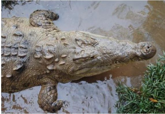
COCODRILO AMERICANO (CROCODYLUS ACUTUS)