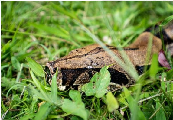
BOAS (BOA CONSTRICTOR)