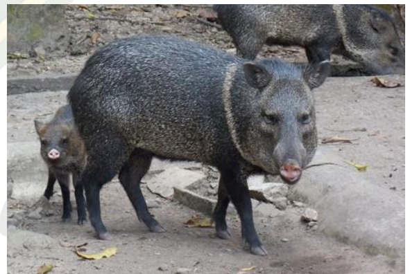
ZAINOS (TAYASSU TAJACU)