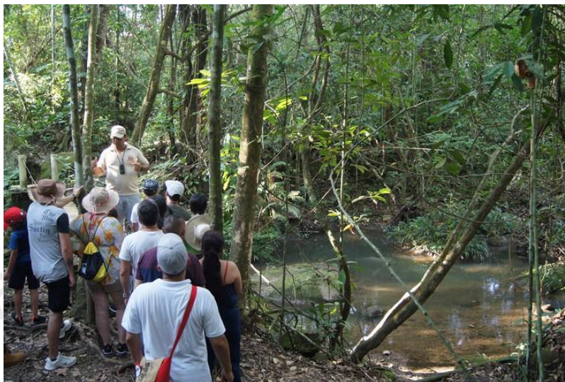
SENDEROS ECOLÓGICOS INTERPRETATIVOS