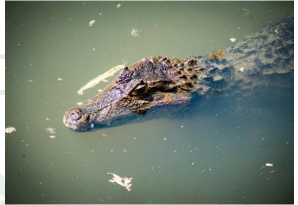
BABILLAS (CAIMAN CROCODYLUS FUSCUS)