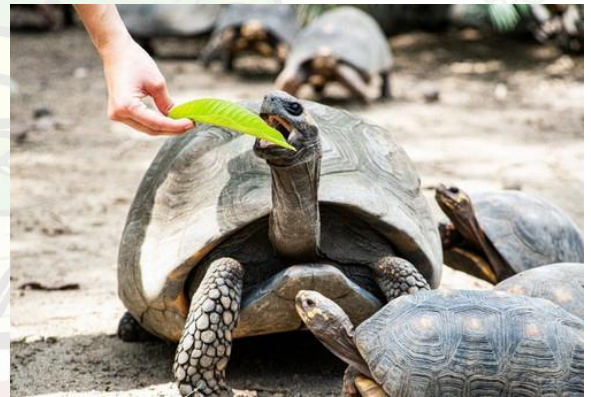
TORTUGAS MORROCOY (CHELONOIDIS CARBONARIA)