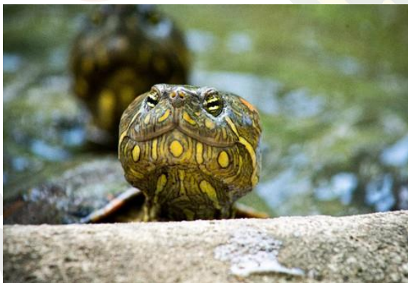
TORTUGAS DE AGUA (TRACHEMYS- PODOCDEMIS)